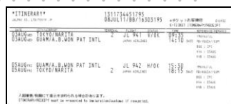
↑「e チケット お客さま控」

O(オー)カウンター前にはジャルバックデスクがあります。再受付の場合はここで案内いたします。尚、スタッフは常時待機しておりますので、ご質問、ご不明点がありましたらご利用ください。