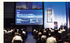
昨年のイベントの様子です。ブースにも多くの方にお越しいただきました。