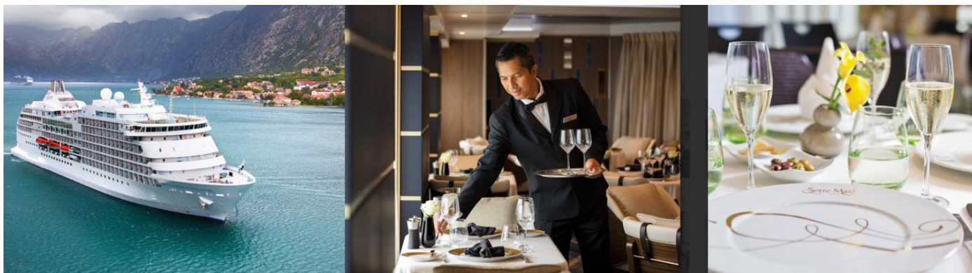
SEVEN SEAS NAVIGATOR