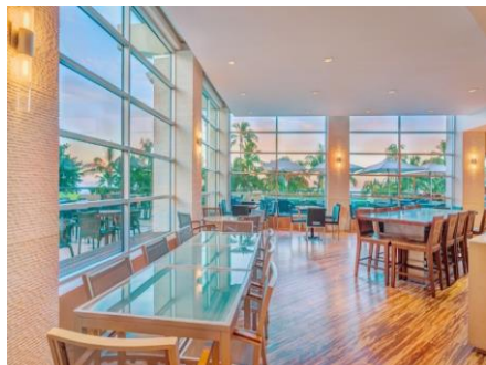
洗練されたデザインの室内