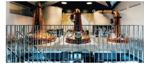
世界でも珍しい3基のポットスチル。上部のラインアームの形状が異なることで、原酒の味わい・香りがより豊かに個性的に変化します。