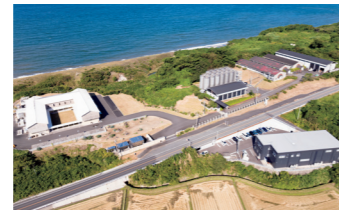
約9,000㎡の広い敷地に建つ嘉之助蒸溜所には、蒸留設備のほか、眺めのいいバーやショップなどが併設されています。