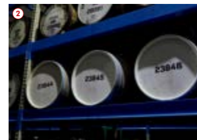
1. ピノ・ノワールを熟成したDuMOL樽は、高品質なワインで知られるカリフォルニア州ソノマのワイナリー「DuMOL」から、株式会社JALUXが調達。 2. 嘉之助蒸溜所の潮風が漂う温度変化の少ない半地下のレガシーの熟成庫で穏やかに熟成したDuMOL樽。