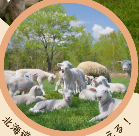
北海道の自然とふれあえる！ えこりん村