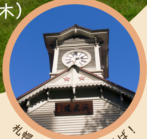
札幌の観光名所といえば！ 札幌市時計台