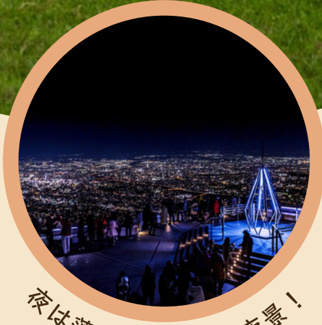
夜は藻岩山の綺麗な夜景！ 藻岩山