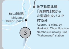
札幌芸術の森美術館 Sapporo Art Museum