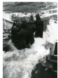
平野正邦《カニ漁網 北千島》1973 HIRANO Yoshikuni, Cod fishing longlines, northern Kuri Islands, 1973