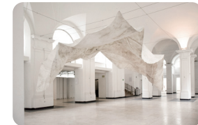
ジョヴァンニ・ベッティ+カタリーナ・フレック 《Invisible Mountain》2021 Giovanni BETTI + Katharina FLECK, Invisible Mountain, 2021

The theater, which has served as the venue for a number of different performances, will be transformed into an exhibition space showcasing artistic expressions that look 100 years into the future. The onstage and backstage mechanisms and even the seating area will transform into an extraordinary place to experience work by internationally renowned artists.