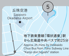
モエレ沼公園 Moerenuma Park