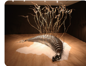
チェウラム《Custos Cavum》2011 CHOE U-Ram, Custos Cavum, 2011

さまざまな公演が行われてきた劇場が、生まれ変わります。ステージ上や舞台裏の機構、客席までもが、国際的に活躍するアーティストの作品を体験できる特別な場所になり、100年後を見つめるための表現が集まります。