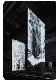
Francis WAMOF Génarins: Vallée de Joux 2018