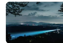
左: パノラマティクス / 青藤精一《JIKU #006 Mind Trail 2020》

This is a snow city that will exist in the future. We will conduct social experiments here to envision our future together using art, with a focus on future transportation, lifestyles, and food.