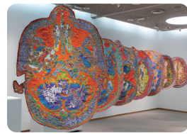
宮田彩加《MRI SM20110908》2016- MIYATA Sayaka, MRI SM20110908, 2016-