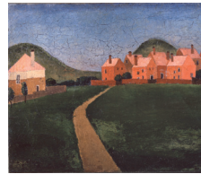
俣野第四郎《大連市郊外》1924 MATANO Daishiro, Suburb of Dairen, 1924

厳しい国際関係に翻弄される北洋漁業の現場を追った写真に始まり、北海道立近代美術館のコレクション、現代のアーティストによる新作インスタレーションなどを紹介して、100年前から今日までを再考します。