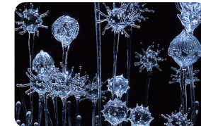
青木美歌《her songs are floating》2007 AOKI Mika, her songs are floating, 2007