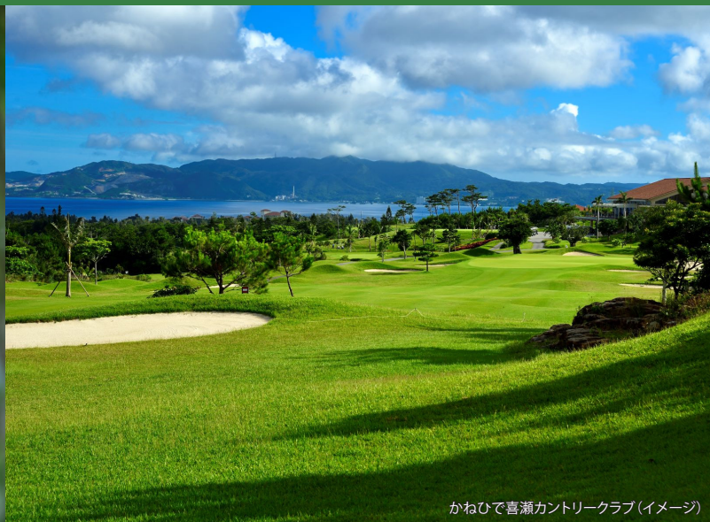
かねひで喜瀬カントリークラブ（イメージ）