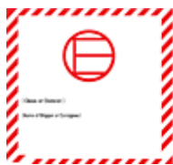
微量危険物マーク

以下のマークは包装物の一面に表示されなければならない、それらのマークをラベルで適用する場合は、ラベルは折れ曲がっていたり、包装物の異なる面にまたがるように貼付されてはならないという規定が、2020年1月1日より発効となります。包装物をご準備いただく際にご注意いただきますようお願いいたします。