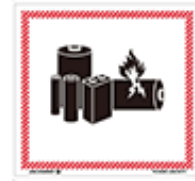
リチウム電池マーク