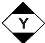
少量危険物マーク