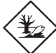
環境有害物質マーク