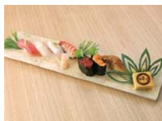
▲寿司盛り合わせ 2,500円(税込)~