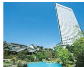
▲シェラトン・グランデ・オーシャンリゾート