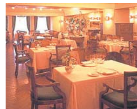
▲エノテカピンキオーリ

詳細・参加登録先 URL www.jalcard.co.jp/campaign/jpp/