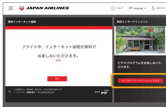
※タブレット/PC画面 ※Tablets and PC screen.